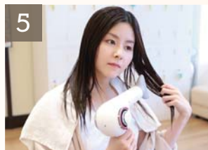
5 セルフブロー お客様自身で行っていただきます ドライヤー・スタイリング剤等は良質な商品をご用意しております ※スタイリストの施術も可能です (別途料金)